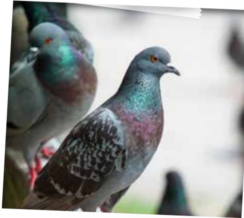
Latijn: Columba livia